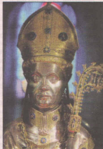
Beeld van Plechelmus, dat mevrouw Essink enige tijd bewaarde.